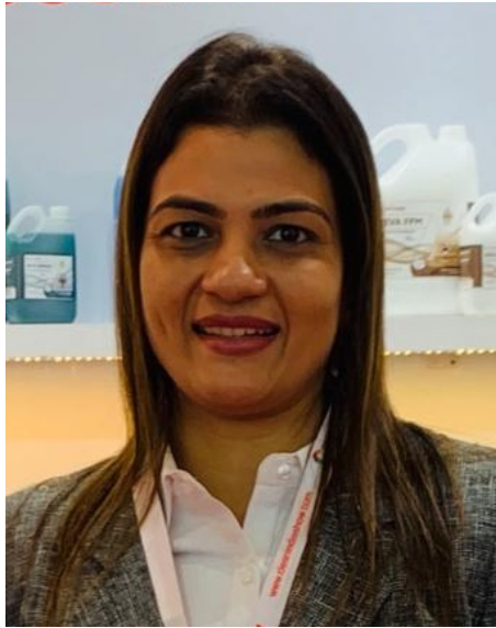
Ms. Hiral Jigar Shah

Eventually he started REVACHEM in 2008 with practically zero capital. Today they are one of the leading professional cleaning chemical brand in India. Revachemical private limited also carries out product development for third parties and eventually do white label manufacturing for them. Their manufacturing unit is located at Palghar and is equipped with all required machinery. They have recently inaugurated product development and application lab at Goregaon and are in the process of setting up a new factory as part of their aggressive expansion plan.